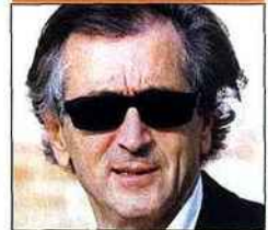
V. Zunino - Celso Gony Images/AFIP