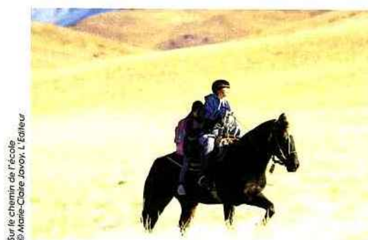
Sur le chemin de l'école © Marie-Claire Javoy, L'Éditeur

EN PARTENARIAT AVEC LA LIBRAIRIE A PLEINE PAGE.