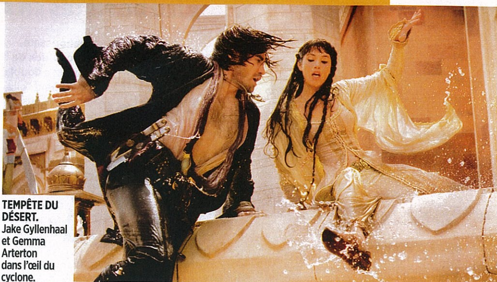
TEMPÊTE DU DÉSERT. Jake Gyllenhaal et Gemma Arterton dans l'œil du cyclone.

Attention, blockbuster en vue: Prince of Persia , adaptation filmée d'un jeu vidéo ultra populaire, déboule sur grand écran avec Jake Gyllenhaal et Gemma Arterton en tête d'affiche. Le play-boy avéré et la toute dernière fille à suivre made in USA endossent le costume du prince Dastan et de la princesse Tamina pour un film d'action moitié Indiana Jones , moitié conte des Mille et Une Nuits . Sur le papier, le casting peut laisser songeur: Gyllenhaal, habitué aux rôles sombres, traîne depuis toujours une mine d'éternel ado un peu blueseux et pas bien musclé. James Bond Girl rouquine dans Quantum of Solace , Gemma Arterton avait jusqu'ici peu à voir avec la brune incendiaire qu'elle incarne pour les besoins de cette nouvelle production Disney. Magie du monde enchanté de Mickey: Jake arbore désormais un sourire Émail Diamant, la chevelure de Samson, un hâle viril et un poitrail de taureau, tandis qu'Emma est devenue une Shéhérazade post-moderne – le genre hot mais qui ne se laisse pas marcher sur les sept voiles. Réunis