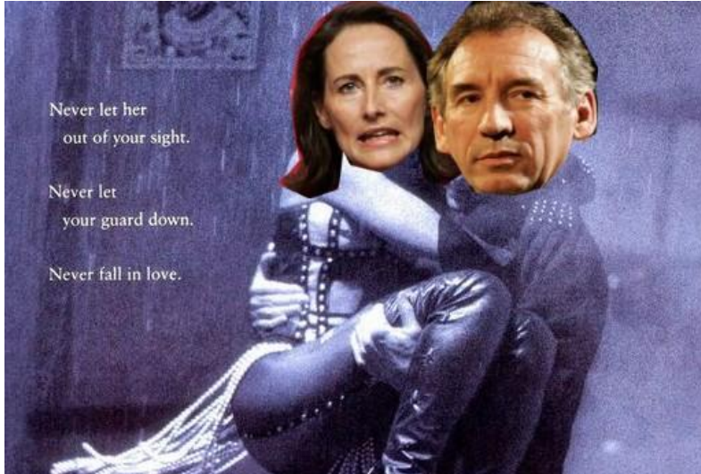
Montage The Bodyguard - Ségolène Royal François Bayrou

Rappelez-vous aussi ce que Ségolène Royal disait de Bayrou, lors de l'entre-deux-tours de la présidentielle de 2007 (Bayrou avait refusé que Royal le rejoigne à son domicile parisien pour parler d'une éventuelle alliance contre Sarkozy) : "Il m'a fait l'impression de l'amant qui craint la panne"