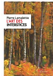
Pierre Lamalattie, L'Art des interstices , L'Éditeur, 2017.

L'accident de sa fille le réveille, d'une certaine manière. Il en fait son assistante. Avec elle, il rencontre à Londres, Bruxelles ou en Finlande des artistes qui, tels des plantes de sous-bois, survivent à l'ombre des troncs massifs d'un art officiel qui tient en suspicion l'image, jugée trop « rétinienne ». Elle prend les photos. Il pourrait croire au bonheur, pendant un moment. Le problème est que dans une époque pleine de psys, de conseillers d'orientation, de visites portes ouvertes de grandes écoles, d'injonctions internétiques, une adolescente devient le prisme privilégié pour voir à l'œuvre le totalitarisme soft. D'où le recours aux interstices, comme Jünger prônait le recours aux forêts : pour aimer, transmettre, créer et tant pis si « beaucoup de gens bien partis, comme moi, n'étaient arrivés à rien. Ce n'était pas bien grave. » •