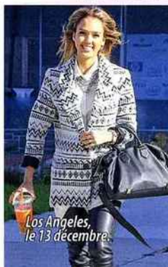
Los Angeles, le 13 décembre.