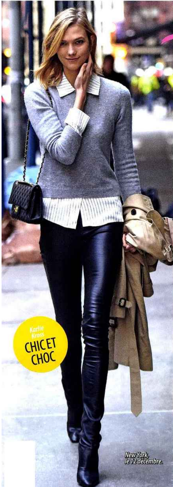
New York, le 12 décembre.