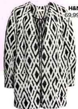
H&M 69,99 €