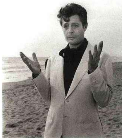
Marcello Mastroianni dans « La Dolce Vita »