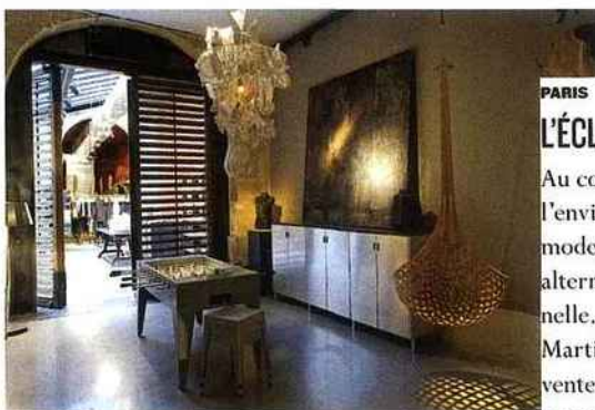
La boutique de la rue Hérold. Elle héberge une galerie entièrement dédiée à l'art contemporain.